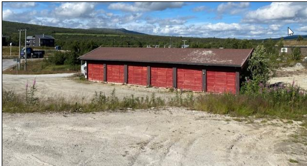
1. Dagnes garasjeanlegg – svært skjemmende og liten funksjon