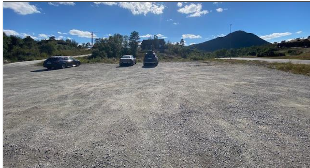
4. Parkeringsplass ved riksvegen.