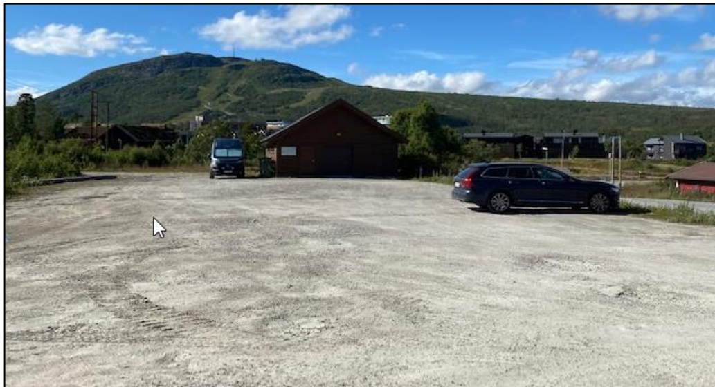
3. Søppelbod. Mangler lys, asfalt, arrondering, torvtak, kapasitet?