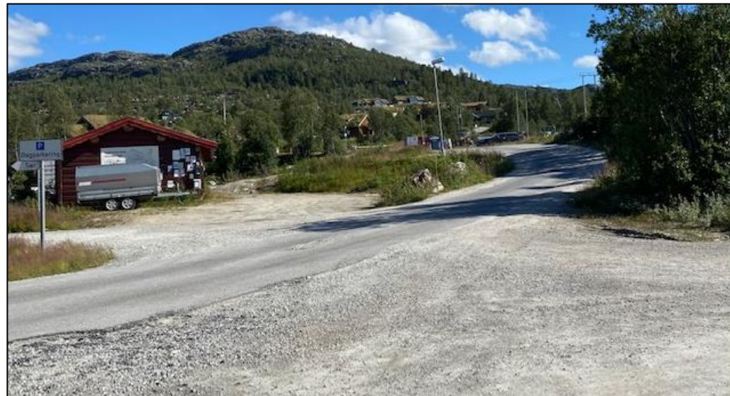
2. Innkjøring fra riksveg. Rotete og stygt