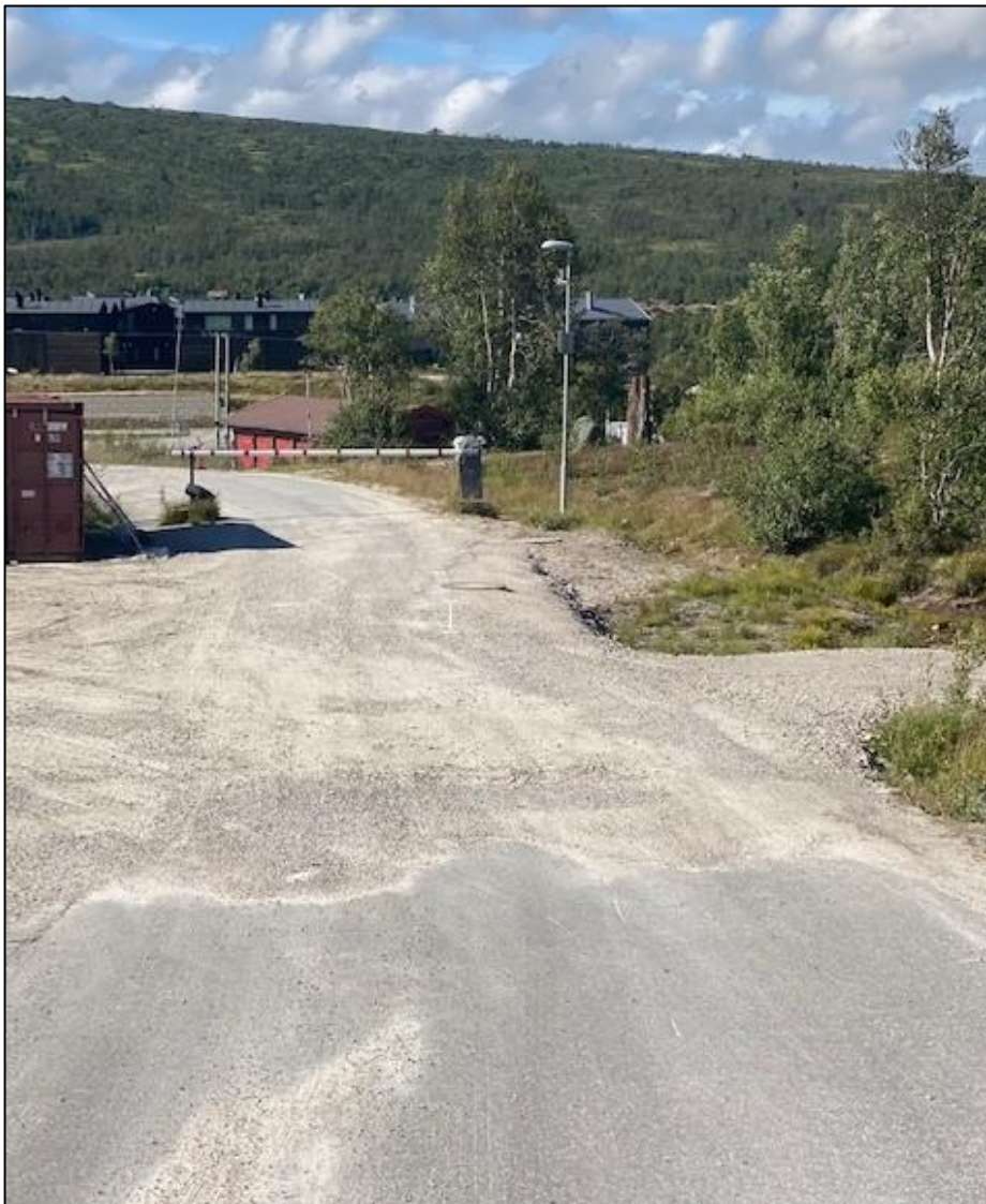
Inngangen til Hartvassnuten – sett fra området mot riksvegen